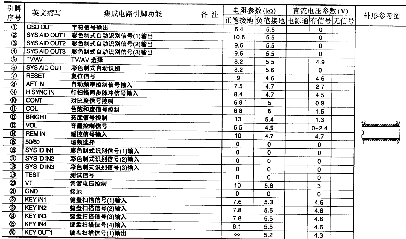
集成电路引脚功能参数