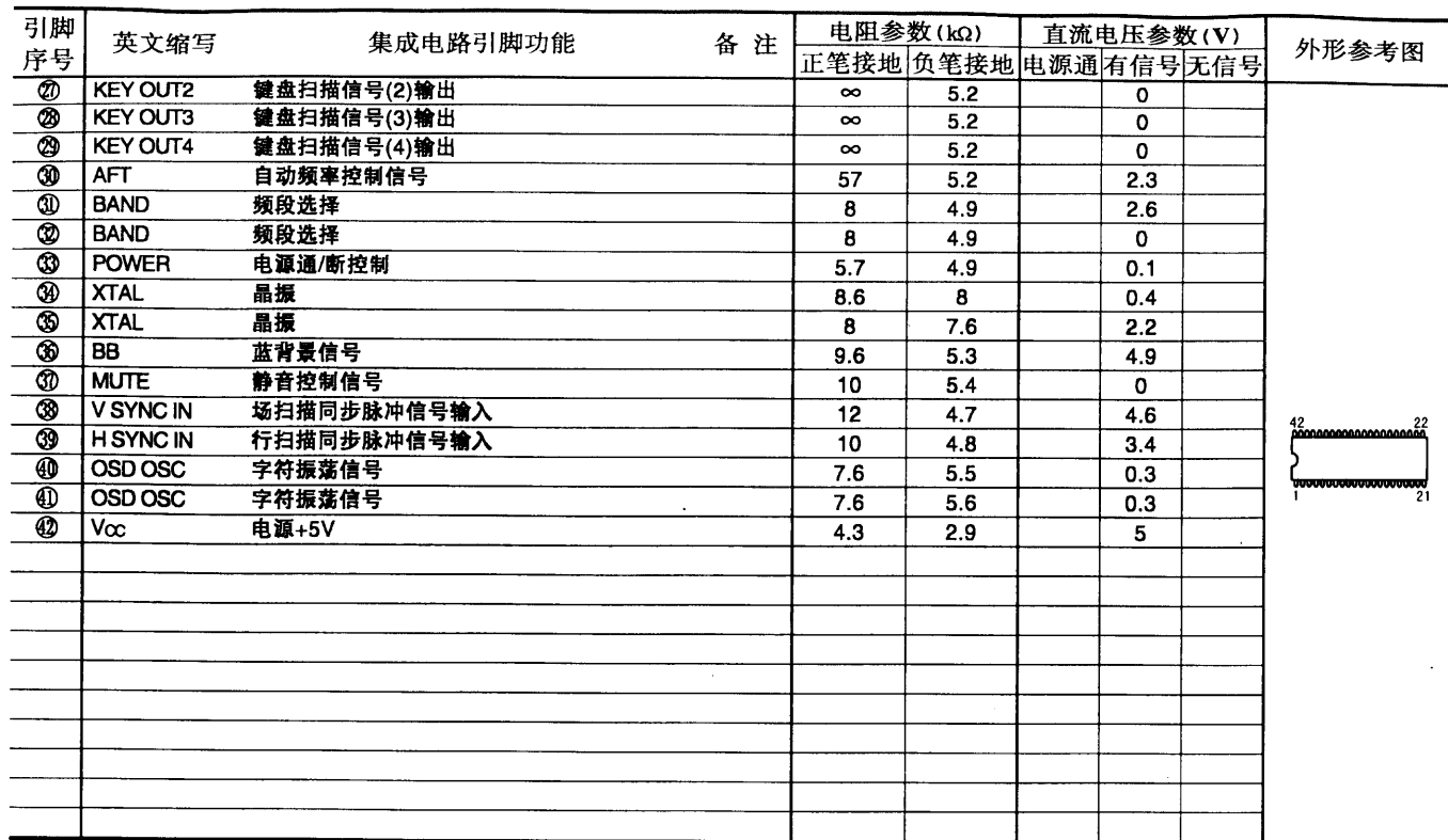
集成电路引脚功能参数