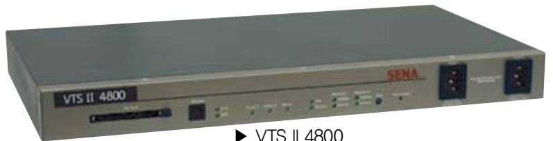
▶ VTS II 4800 48-포트 지능형 콘솔 서버