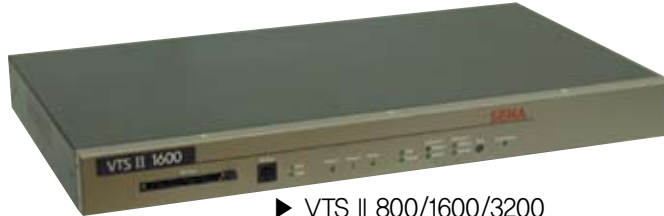
▶ VTS II 800/1600/3200 8/16/32-포트 지능형 콘솔 서버