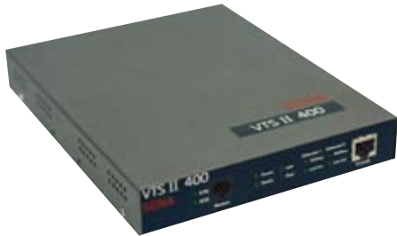
▶ VTS II 400 4-포트 지능형 콘솔 서버