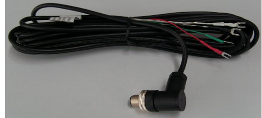
연결선 (방수등급:IP67, 길이:5m)