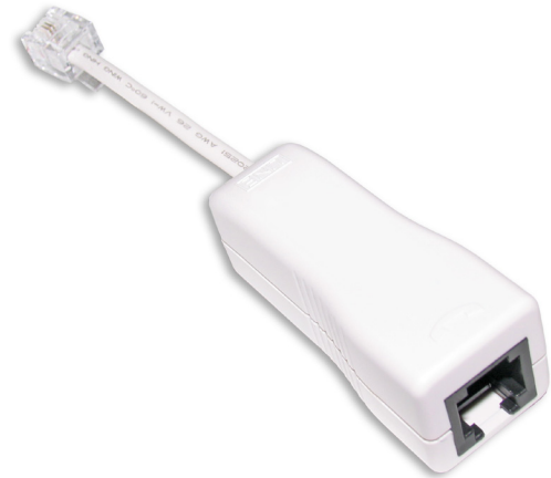
Z-369LS microfiltro residencial ADSL